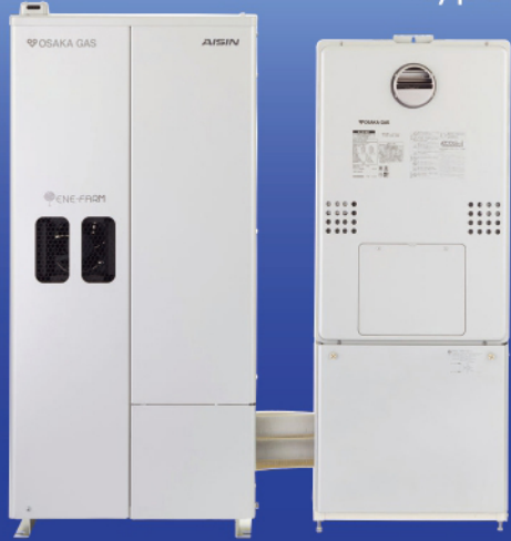
192-AS11型+136-N450型(停電時自立発電機能付き) 192-AS12型+136-N450型(停電時自立発電機能なし)